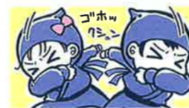
イラスト：青鹿ユウ

咳をする時、口元を手のひらで覆っていませんか？実はこれは、多くの方がしている誤った咳エチケット。咳の飛沫で出た菌やウイルスを手で受け止めると、そこから感染を広げてしまいます。園では、咳をする時は、右図のように、「忍者に変身！」スタイルなど、咳を腕で防ぐことを子ども達に勧めています。