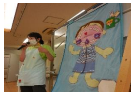
虫歯予防について